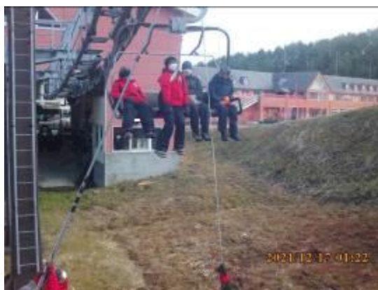
② 令和3年12月18日(土) 13:00～16:30 非常時対応訓練